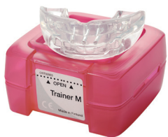
Střední nástroj LM-Trainer™ LM 94100T

Nástroj LM-Trainer™ lze použít u dočasného chrupu, např. před ošetřením aktivátorem LM-Activator™. Lze jej také využít při funkční výuce a korekci návyků, např. při špatném typu polykání a ústním dýchání, kdy škodlivé návyky v ústní dutině mohou způsobit malokluze.