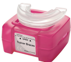
Rovnátkový nástroj LM-Trainer™ LM 94100TB