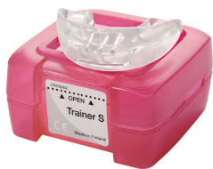
Malý nástroj LM-Trainer™ LM 94100S