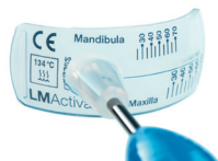
LM 9400 LM-OrthoSizer™